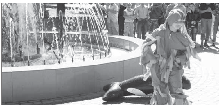
■ Когда на улице жарко, у фонтана многолюдно.